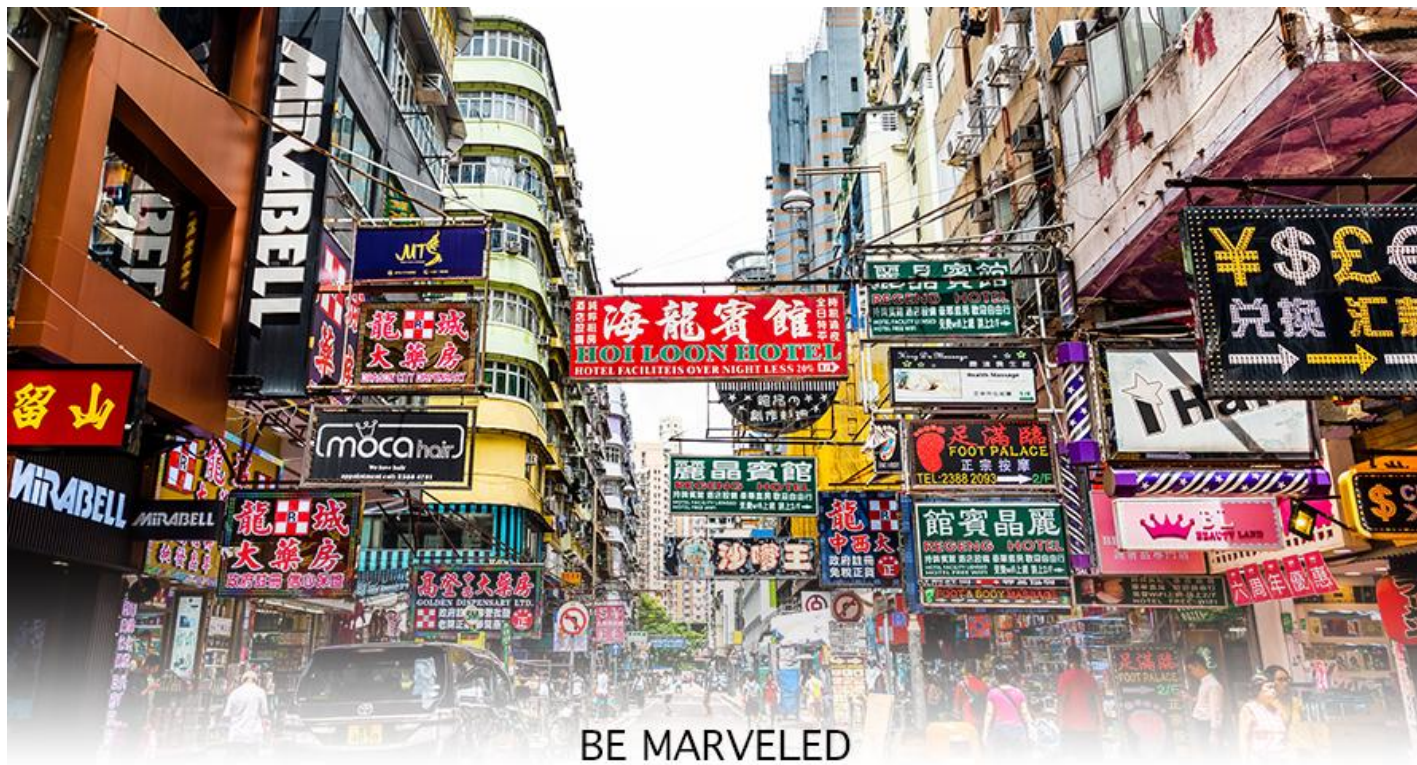
BE MARVELED MONGKOK

เครื่องประดับมากมาย อีกทั้งยังมีร้านอาหารและเครื่องคั้ม ที่ขึ้นชื่อหลากหลายชนิด ให้ทุกท่านได้ลองลิ้มรสอีก มากมาย