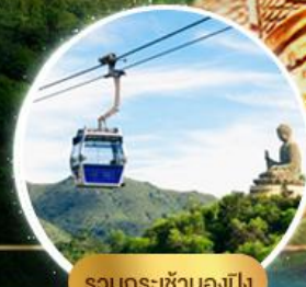
รวมกระเช้าฮ่องกง