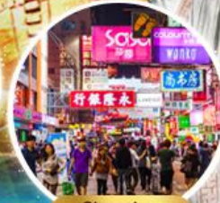
Shopping Taim Sha Tsui