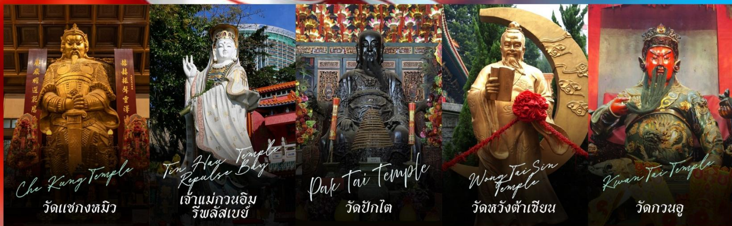
Che Kung Temple วัดแชกงทมิว

รายการทัวร์ข้างต้นอาจมีการปรับเปลี่ยนเพื่อความเหมาะสม