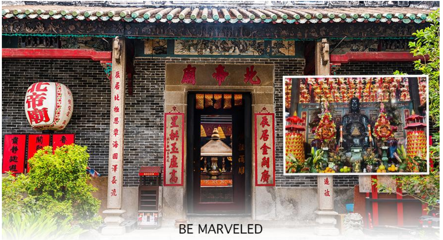
BE MARVELED วัดปักไต้

แห่งท้องทะเล ในลัทธิเต๋า และชาวฮ่องกงเชื่อกันว่าผู้ใดที่เกิดปีชง หากมาทำการแก้ดวงชะตาแก้ชงประจำปีที่วัดนี้ จะทำให้ร้าย กลายเป็นดีได้ และที่วัดยังมี “เทพเจ้าเปลี่ยนใจ” ที่นิยมมาขอพรให้เรื่องที่ไม่ดี กลายเป็นเรื่องดีหรือ คนที่เป็นศัตรูของเราเปลี่ยนใจมาเป็นมิตร เป็นที่นิยมอย่างมากของชาวท้องถิ่นฮ่องกงมากราบไหว้ขอพรกันที่วัดนี้