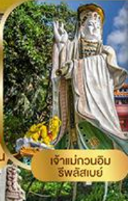
เจ้าแม่กวนอิม ริวลิสมะ