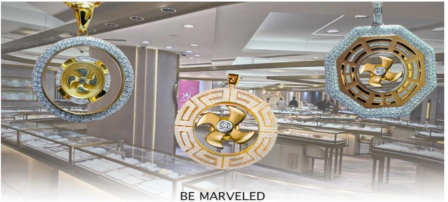
BE MARVELED ศูนย์จิวเวลรี่ กัวฮันเศรษฐี

และนำท่าน ชม ศูนย์ปีเซี่ยะ ซึ่งคนจีนนั้น ถือว่าหยกเป็นหิน ที่เป็นตัวแทนของความสวยงามและความบริสุทธิ์มีความเชื่อว่า หยก มงคล ถ้าพกติดตัวไว้จะอายุยืนและสุขภาพดีมีสินค้ำมากมายเกี่ยวกับหยก อาทิ กำไลหยก หรือสัตว์นำโชคอย่างปีเซี่ยะ ให้ ท่าน ได้เลือกซื้อเป็นของฝาก, ของที่ระลึก หรือของนำโชคแต่ตัวท่านเอง