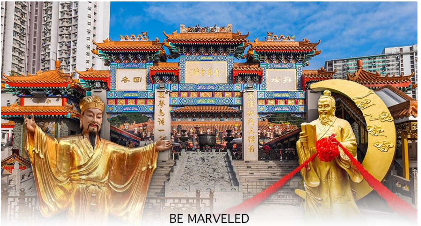
BE MARVELED วัดหวังต้าเซียน