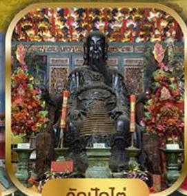
วัดปุกโต