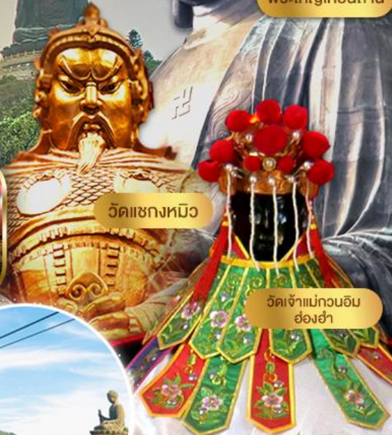
วัดแซงหนิว