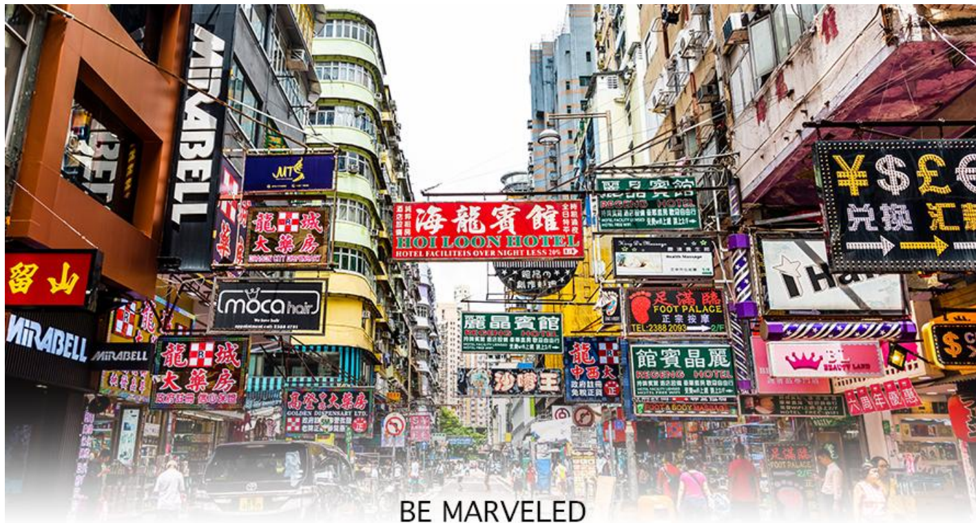
BE MARVELED MONGKOK

หลังจากนั้นนำทุกท่าน ช้อปปิ้ง ย่านมงก๊ก (Shopping Mongkok) เป็นแหล่งช้อปปิ้งที่เต็มไปด้วยตรอกซอกซอยที่มีเอกลักษณ์แปลกตา รวมทั้งตลาดเก่าแก่ที่สะท้อนเสน่ห์ และวิถีชีวิตของคนท้องถิ่น ถือเป็นหนึ่งในย่านยอดนิยมที่นักท่องเที่ยวทุกคนต้องแวะเวียนมา มีร้านสวยๆ บาร์เท่ๆ หลบซ่อนตัวอยู่มากมาย ภายในย่านมีตลาดนัด LADIES' MARKET ขนาดใหญ่ ซึ่งมีร้านขายเสื้อผ้า เครื่องสำอาง รองเท้า กระเป๋า เครื่องประดับมากมาย อีกทั้งยังมีร้านอาหารและเครื่องดื่ม ที่ขึ้นชื่อหลากหลายชนิด ให้ทุกท่านได้ลองลิ้มรสอีกมากมาย