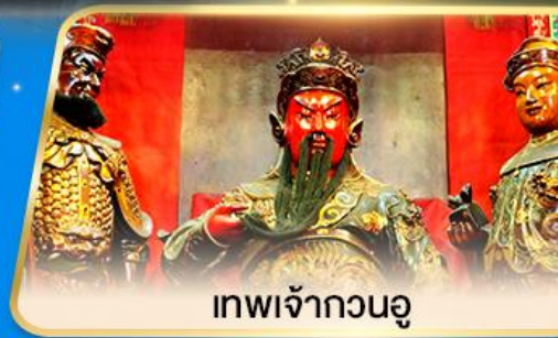
เทพเจ้ากวนอู