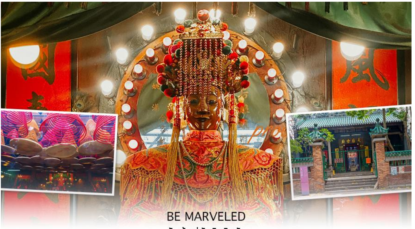
BE MARVELED วัดเจ้าแม่ทับทิมกินหัว

หลังจากนั้นนำทุกท่านเดินทางไปยัง Citygate Outlets เป็นแหล่งรวมร้านค้าตรงจากผู้ผลิตที่ใหญ่ที่สุดในฮ่องกง โดยรวบรวมกว่า 150 แแบรนด์ระดับโลกไว้ในที่เดียว โดยแจกส่วนลดสูงสุด 90% ตลอดทั้งปี แวะช้อปปิ้งแฟชั่นและเครื่องประดับ สินค้าเพื่อสุขภาพและความงาม สินค้าอิเล็กทรอนิกส์ จิวเวลรีและนาฬิกา เสื้อผ้าเด็ก กีฬาและกิจกรรมกลางแจ้ง ฯลฯ