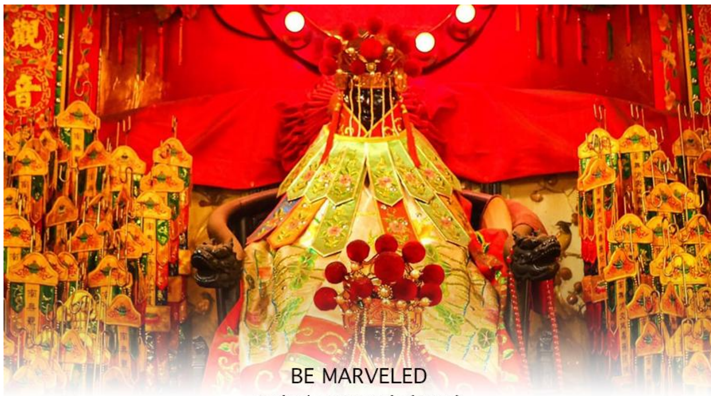
BE MARVELED วัดเจ้าแม่กวนอิมฮวงอ่า (ยิมวิน)

หรือ วันเปิดทรัพย์ เป็นความเชื่อของคนเชื้อสายจีน ทั้งฝั่งฮ่องกง และมาเก๊าถือเป็นพิธีศักดิ์สิทธิ์ในการขอพรเจ้าแม่กวนอิม เชื่อกันว่าเป็นการไหว้และการทำพิธีที่ช่วยเสริมดวงให้เงินทองไหลมาเทมา การขอยืมเงินองค์กวนอิม ที่ขึ้นชื่อเรื่องความเมตตา หรือทำการค้า เปิดธุรกิจค้าขายเจริญรุ่งเรือง