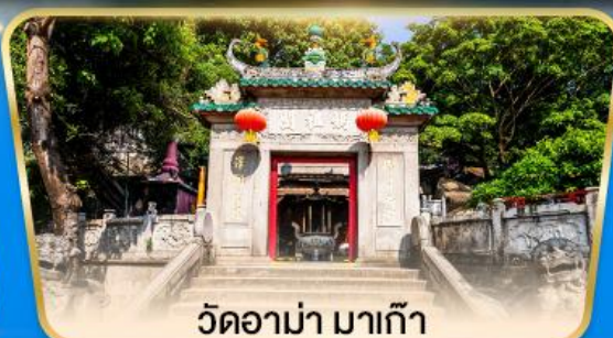
วัดอาม่า มาเก๊า