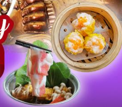
วัดเขกงหนิว